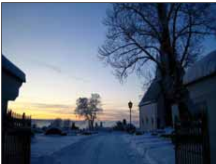
Stange kirke.