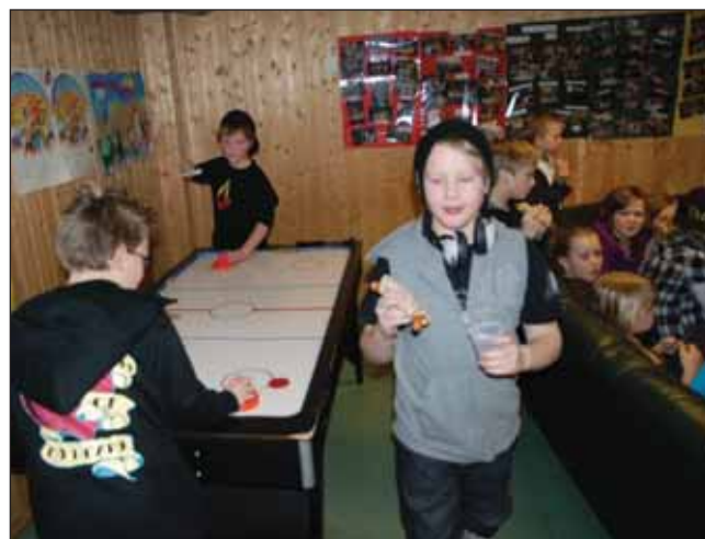
SMUK – Ungdomsklubben på Vollbo for 5.–7. klasse blir på disse fredagene: 12. mars, 9. april og 30. april.

Barnehagen takker foreldre og andre for lånet av klær og annet utstyr til denne dagen.